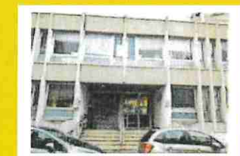
Service social 6 rue Charron