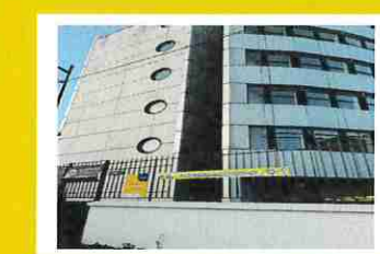
Digitale Académie 40 rue de la Haie Coq