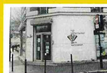
Mosaïque 95 rue Henri Barbusse