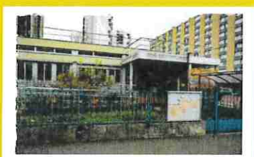
Maison Pour Tous Berty Albrecht 44-46 rue Danielle Casanova