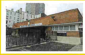
Maison des Services Mahsa Amini 1 rue Ernest Prévost