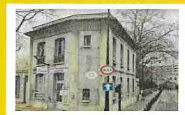
Bureau d'Information Jeunesse 22 rue Bernard et Mazoyer