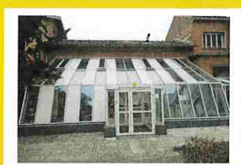
Pôle santé des Femmes et Santé sexuelle - bât C 5 rue du Dr Pesqué