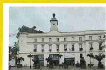
Hôtel de Ville 2 rue de la Commune de Paris