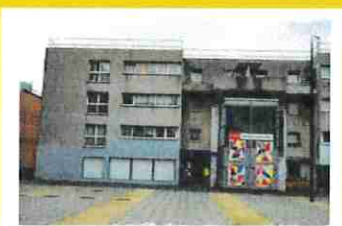
Maison Pour Tous Roser 38 rue Gaëtan Lamy