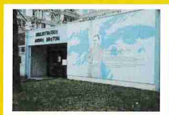
Médiathèque André Breton 1 rue Bordier