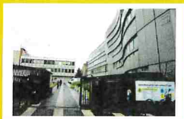
Centre Municipal de Santé 1 er étage – bât A 5 rue du Dr Pesqué