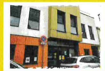
Fabrique de Santé 20 rue du Colonel Fabien