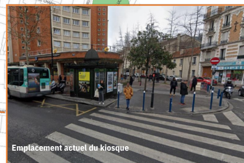
Emplacement actuel du kiosque