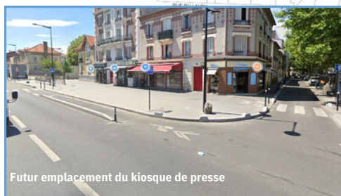
Futur emplacement du kiosque de presse