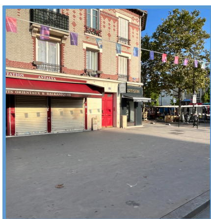
Futur emplacement du kiosque de presse