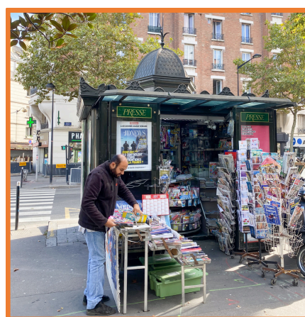
Emplacement actuel du kiosque