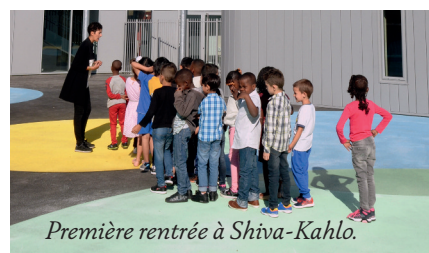
Première rentrée à Shiva-Kahlo.