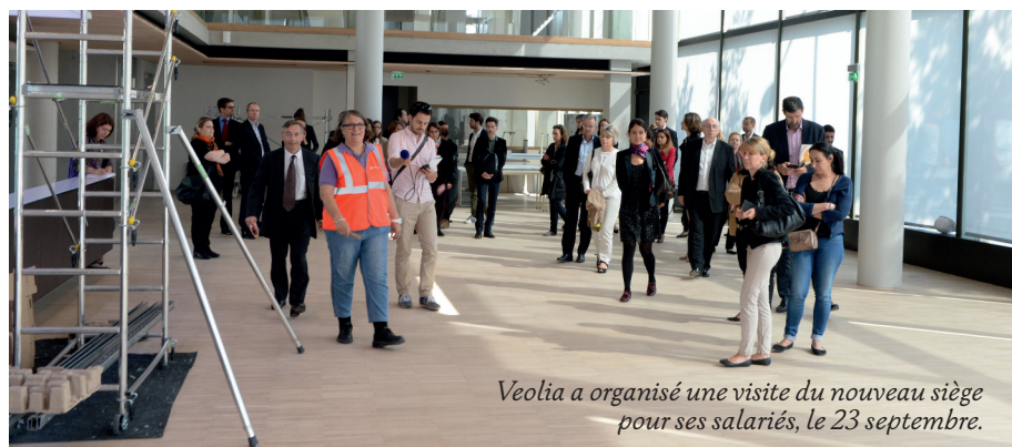
Veolia a organisé une visite du nouveau siège pour ses salariés, le 23 septembre.