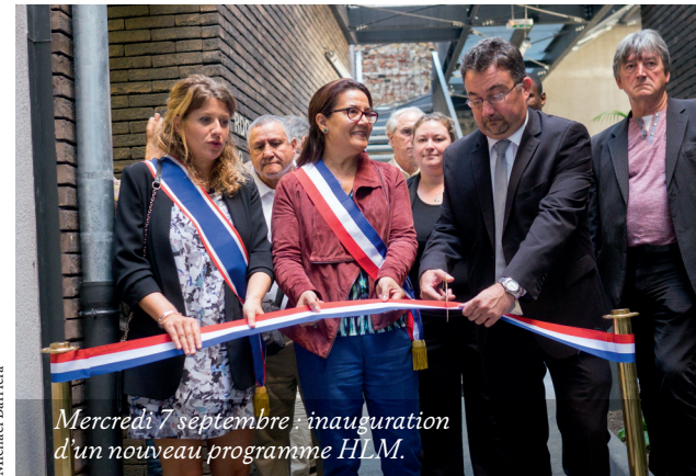
Mercredi 7 septembre : inauguration d'un nouveau programme HLM.