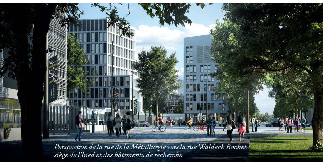
Perspective de la rue de la Métallurgie vers la rue Waldeck Rochet, siège de l'Ined et des bâtiments de recherche.