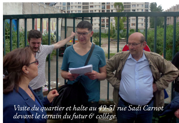
Visite du quartier et halte au 49-51 rue Sadi Carnot devant le terrain du futur 6 e collège.

Les élus ont ensuite, unanimement, voté l'envoi d'une délégation au Festival culturel pour la paix de Beit Jala, fin septembre dernier, et l'octroi d'une bourse en faveur d'une nouvelle élève palestinienne prochainement accueillie au Conservatoire à rayonnement régional (CRR93).