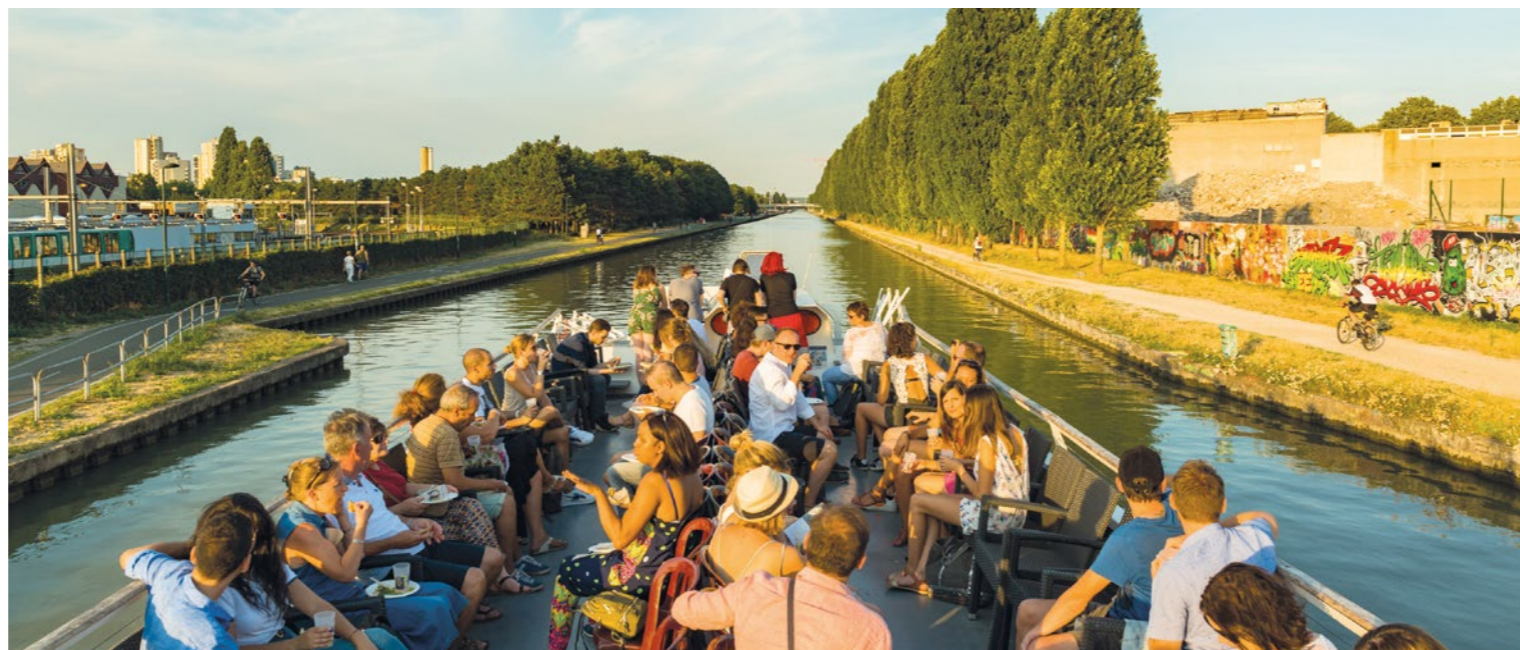
PHOTOS: Été du Canal - © Arthur Crestani - LIVA © 2019 - studioflow.accom